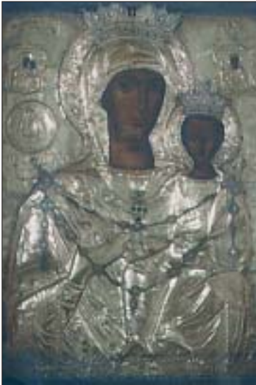
ΑΓΙΑ ΜΟΝΗ (ΠΑΝΑΓΙΑ) ΚΥΘΗΡΩΝ