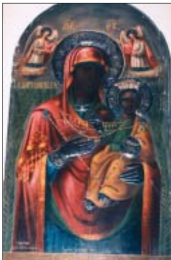
Παναγία ἡ Μυρτιδιώτισσα τοῦ Ἱ. Ναοῦ τοῦ Ν. Φαλήρου