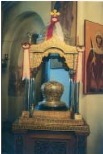
Ἡ Τιμία Κάρα τοῦ Ὁσίου Θεοδώρου τοῦ ἐν Κυθήροις.

Τιμία Κάρα τοῦ Ὁσίου Θεοδώρου τοῦ ἐν Κυθήροις. Ἱεραὶ Λειψανοθήκαι εἰς Ἱεράν Μονήν Μυρτιδίων. Ἱερόν Λείψανον Ἁγίου Ἱερομάρτυρος Ἐλευθερίου. Ἱερά Λείψανα Ἁγίας Ὁσιοπαρθενομάρτυρος Ἀναστασίας τῆς Ρωμαίας καί Ἁγίας Ἀναστασίας Φαρμακολυτρίας. Ἱερόν Λείψανον Ἁγίου Ἱερομάρτυρος Χαραλάμπους τοῦ Θαυματουργοῦ. Ἱερόν Λείψανον Ἁγίου Ἱερομάρτυρος Μύρωνος, Πολιούχου τῶν Ἀντικυθήρων καί ἕτερα Ἱερά Λειψανοθήκη ἐν Ἀντικυθήροις μέ ἱερά Λείψανα διαφόρων Ἁγίων. Ἱερά Λείψανα Ἁγίων Μαρτύρων Εὐστρατίου, Αὐξεντίου, Εὐγενίου καί Μαρδαρίου.