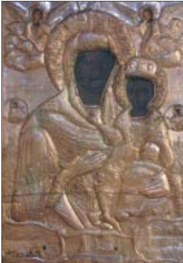
Παναγία ἡ Μυρτιδιώτισσα Ἱ. Μητροπολιτικοῦ Ναοῦ Ἀθηνῶν