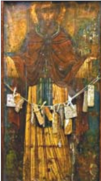
Ὁ Ὅσιος Θεόδωρος ἐν Κυθήροις.